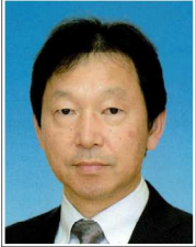
東北マーチングバンド・バトントワーリング連盟 副会長(日本マーチングバンド協会東北支部副会長)

TEL:0187(86)0560 FAX:0187(86)0561 E-mail:ajmbta@obako.or.jp http://jmba-tohoku.org/